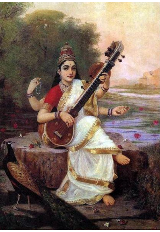
ப்ராதர்த்யாயாமி காயத்ரீம் ரவிமண்டல மத்யகாம் | ருக்வேதமுச்சாரயந்தீம் ரக்த வர்ணாம் குமாரிகாம் | அக்ஷமாலாகராம் ப்ரஹ்ம தைவத்யாம் ஹம்ஸவாஹநாம்